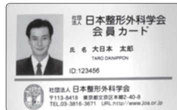
< IC 会員カード見本 >

現在、カードがお手元のない方は 日整会事務局 まで お問い合わせください。(03-3816-3671)